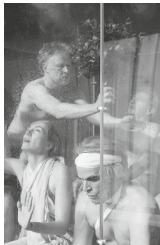
TANZENDE IDIOTEN